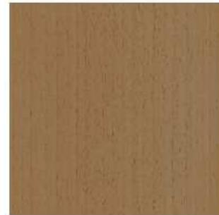
PLANCHE 400x400x18 QTE: 2