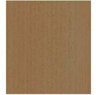
PLANCHE 400x364x18 QTE: 2