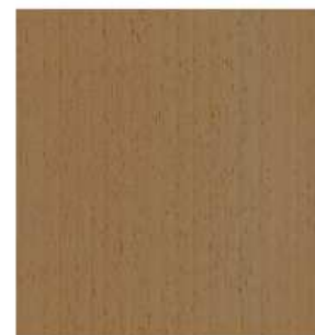
PLANCHE 400x364x18 QTE: 1