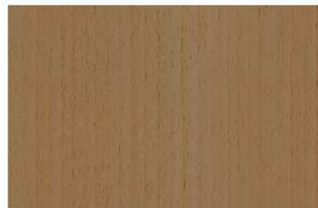
PLANCHE 600x400x18 QTE: 5