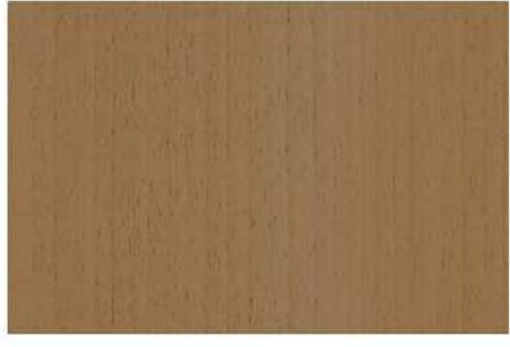
PLANCHE 600x400x18 QTE: 2