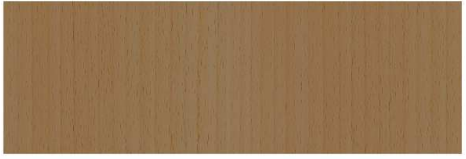
PLANCHE 1200x400x18 QTE: 3