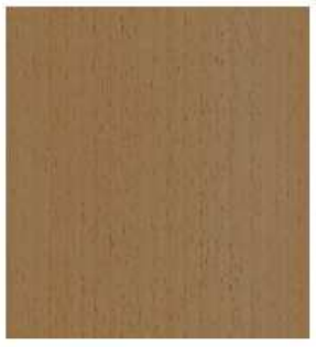
PLANCHE 400x364x18 QTE: 4